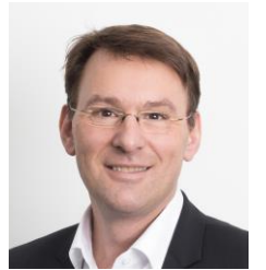
Rödl & Partner