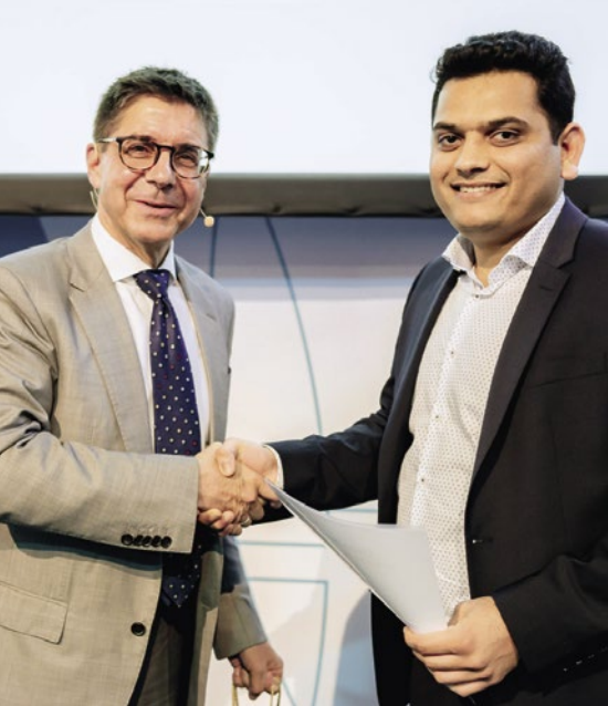
Verleihung der renommierten Auszeichnungen im Facility Management