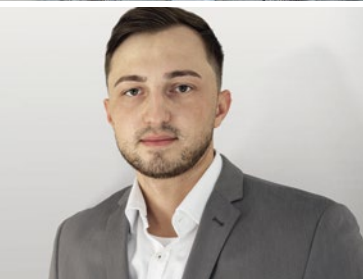
Gewinner der GEFMA Förderpreise 2020