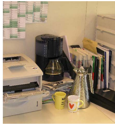
priv. Elektrogeräte im Betrieb