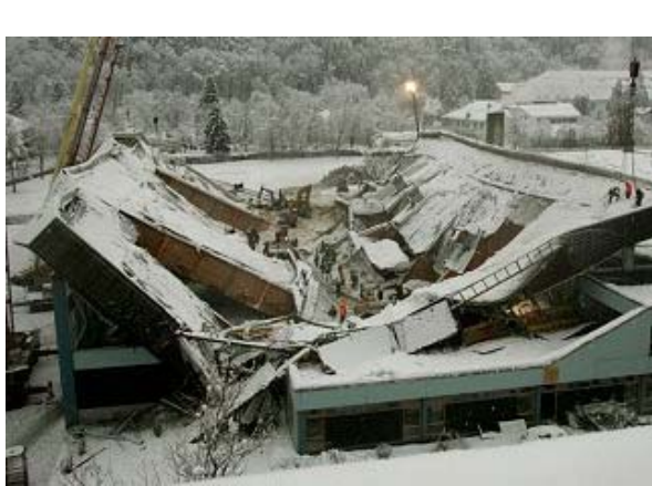
Einsturz von Gebäuden