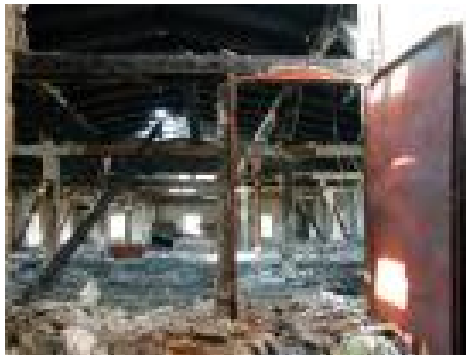
verkeilte Brand-/ Rauchschutztüren